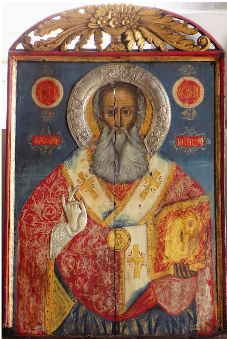
Слика 5 Свети Атанасије Александријски Figure 5 Saint Athanasius of Alexandria