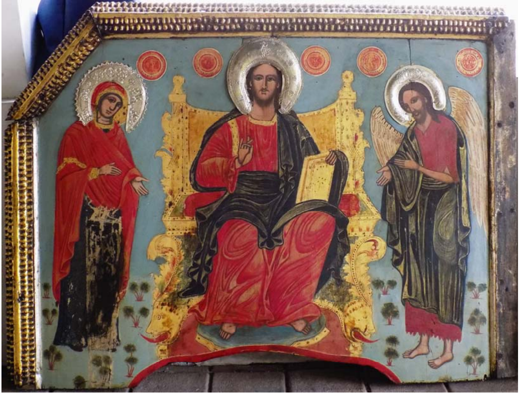
Слика 3 Деизис Figure 3 Deesis