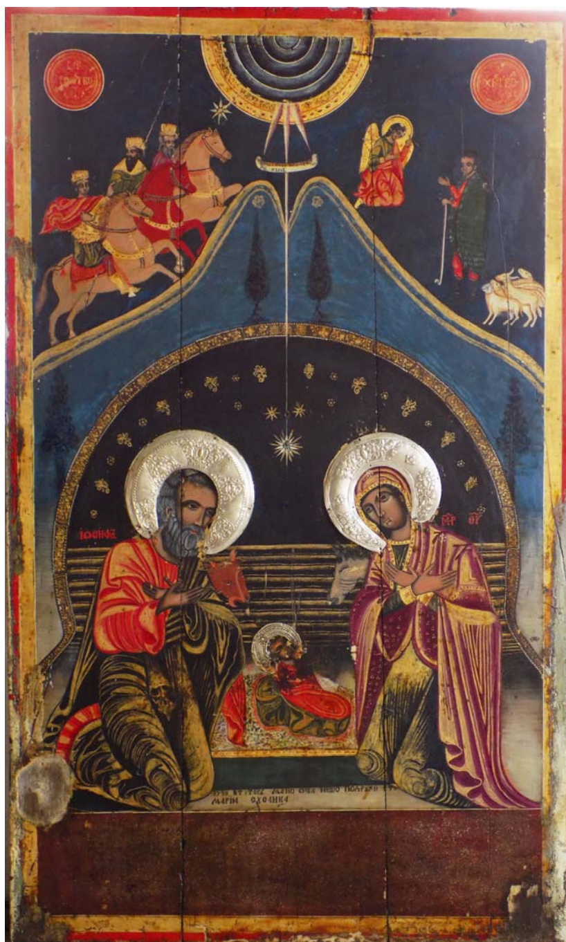
Слика 1 Икона Рођења Христовог Figure 1 Nativity of Jesus Christ