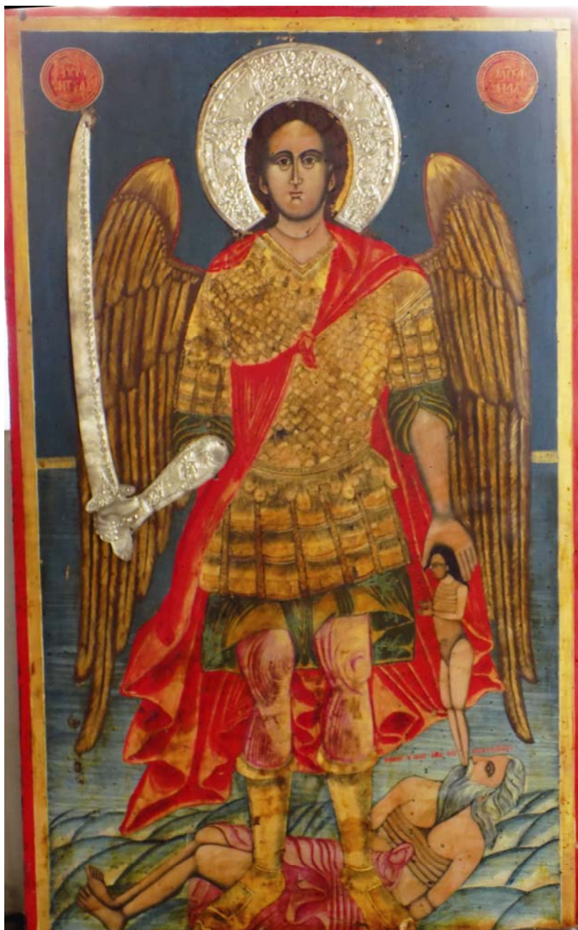
Слика 4 Свети архангел Михаило Figure 4 Saint archangel Michael