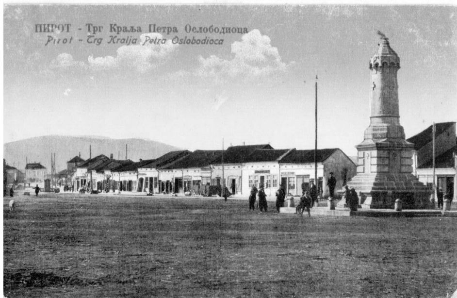
Слика 1 Разгледница – Трг краља Петра у Тијабари Picture 1 Postcard – King Petar Squire in Tjibara

колективним идентитетом подразумева се слика коју нека група гради о себи и са којом се њени чланови идентификују. Тако обликован идентитет је јак колико је и заступљен у свести својих чланова, и колико је у стању да мотивише њихово мишљење и деловање. У случају споменика ослободиоцима било је неопходно да Пирот добије трајни белег који ће у новом амбијенту свакодневно подсећати на победу и утицати на креирање културног сећања уз помоћ визуелне културе.