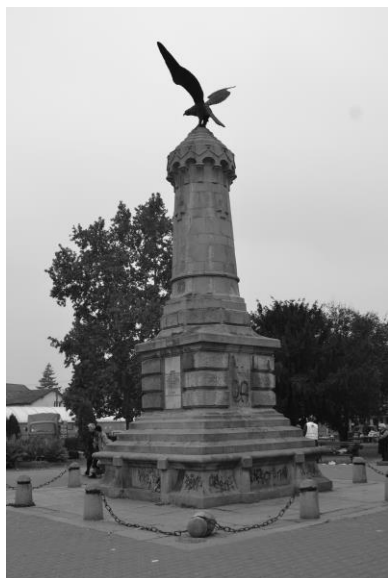
Слика 2 Споменик ослободиоцима Пирота у Тијабари Picture 2 Pirot Liberators Monument in Tjibara