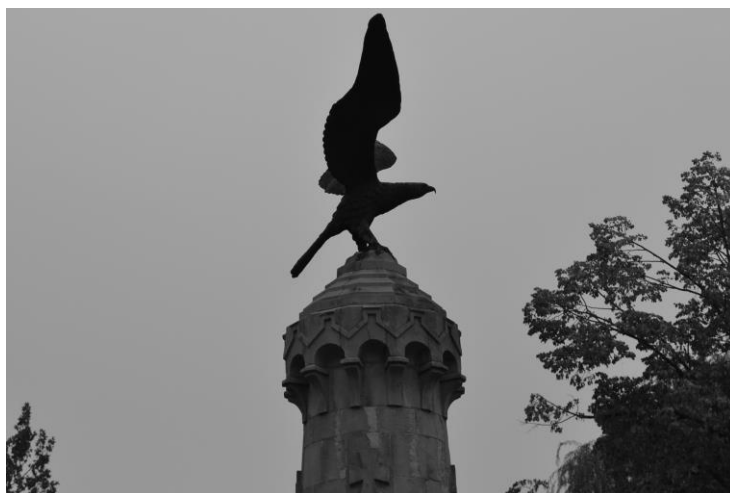
Слика 4 Споменик ослободиоцима Пирота у Тијабари – детаљ Picture 4 Pirot Liberators Monument in Tjibara - detail