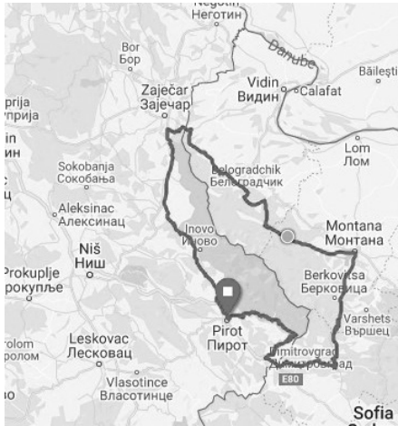
Слика 3 Могући правци кретања војске Василија Цинцилука од Смилиса до Зајечара (савремена путна карта)

Figure 3 Possible directions of the movement of Vasilije Cinciluk's army from Smilis to Zaječar (modern road map)