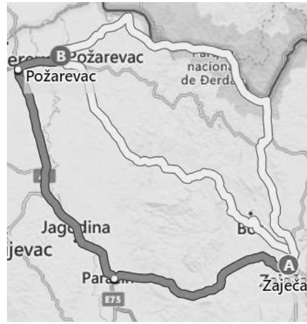
Слика 4 Могуће трасе кретања војске Василија Цинцилука од Зајечара до Пожаревца (савремена путна карта)

Figure 3 Possible directions of the movement of Vasilije Cinciluk's army from Smilis to Zaječar (modern road map)